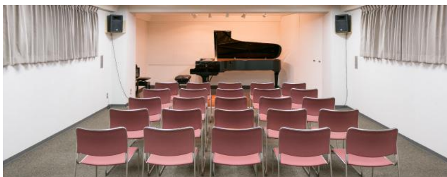
3F スタインウェイスタジオ